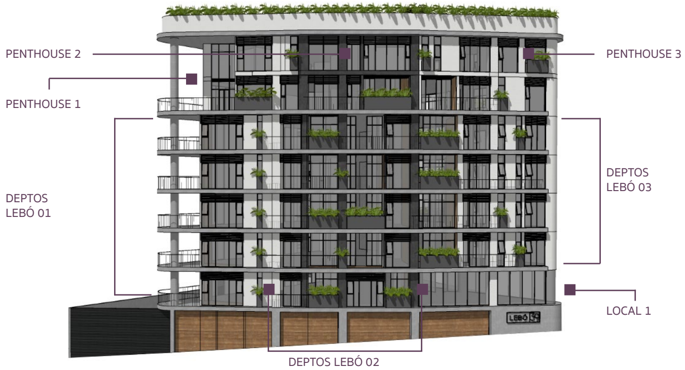
FACHADA CALLE MATAMOROS