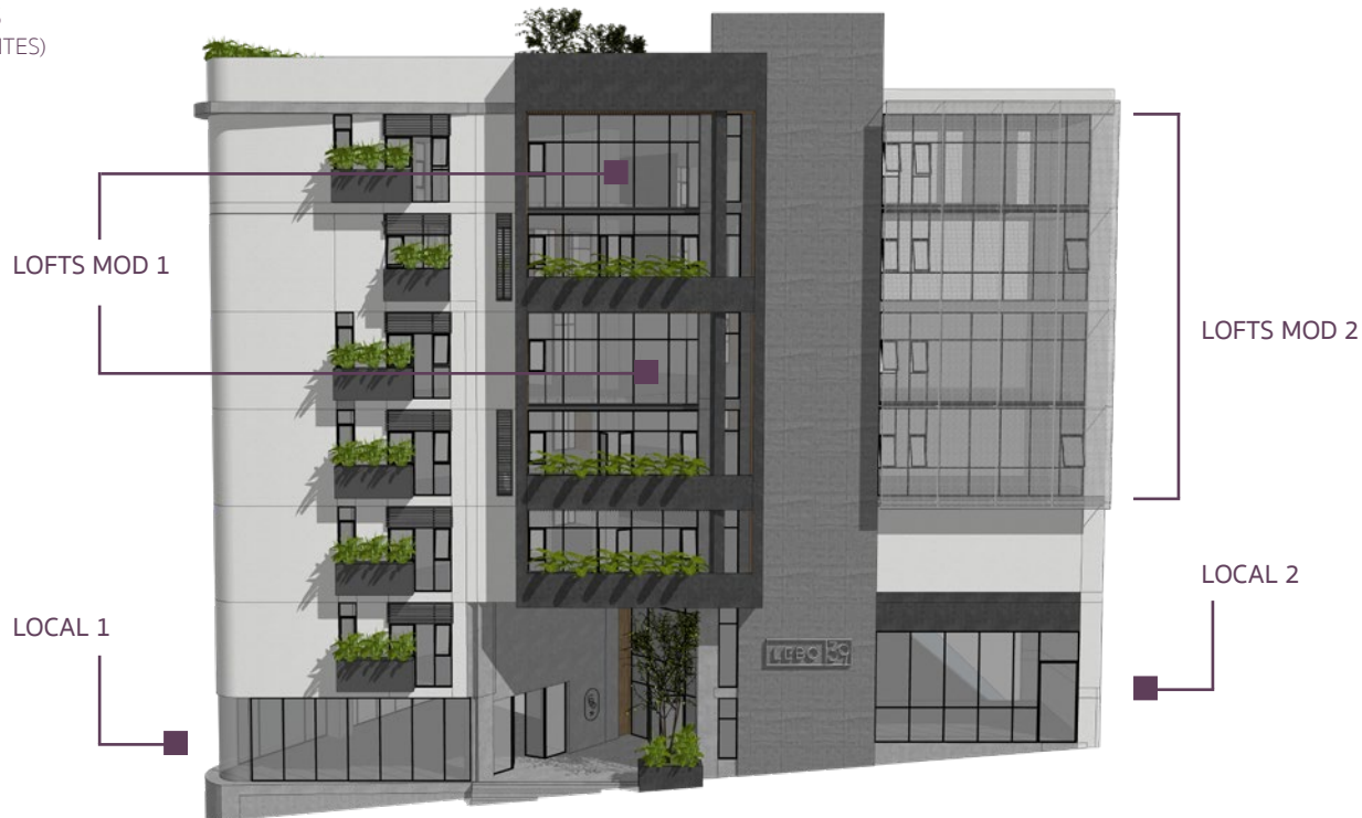
FACHADA CALLE HUAMANTLA